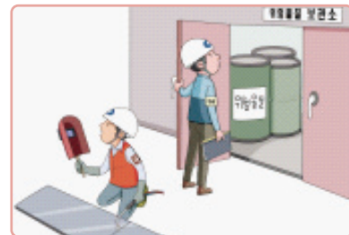
위험물질은 별도 보관