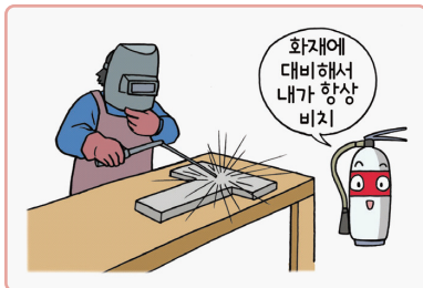
가연성물질에 대한 방호조치·소화기구 비치