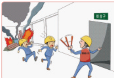
사용가능한 대피로 확보