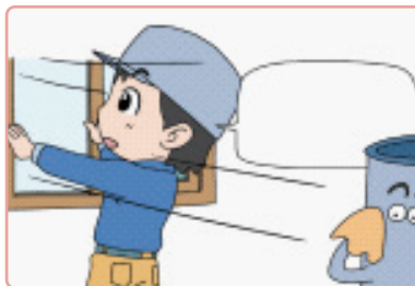
환기 및 가스 검지·경보장치