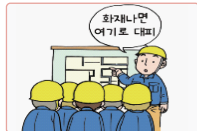
화재위험작업 에 대한 교육