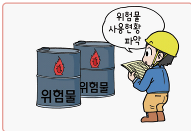
건설현장 내 위험물, 가연물 파악